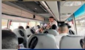
การดำเนินงานนอกสถานที่