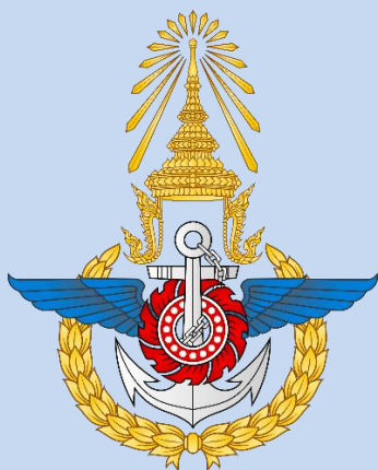
เครื่องหมาย กองบัญชาการกองทัพ