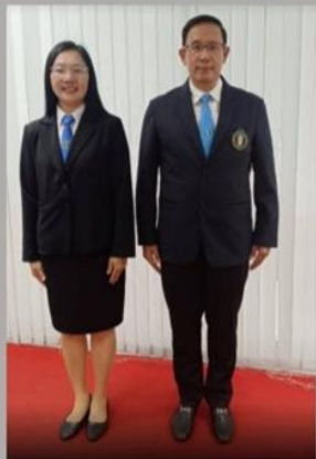
สุภาพสตรี ในวันเรียนตามปกติ ห้ามใส่กางเกงขายาว/ฮีนส์